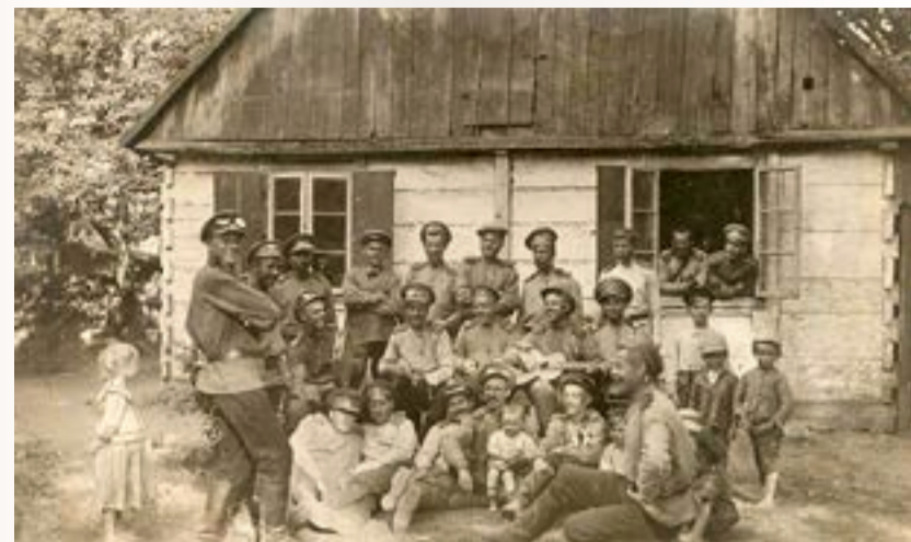
Личный состав Отдельной автомобильной зенитной батареи в минуты отдыха

Несмотря на принятые русским командованием меры, противник продолжал периодически беспокоить прифронтовую зону наших войск. Воздушным налетам подверглись гг. Плонск, Гродно и другие населенные пункты, с человеческими жертвами среди местного населения 18 . В середине мая германская авиация неоднократно бомбила г. Белосток 19 .