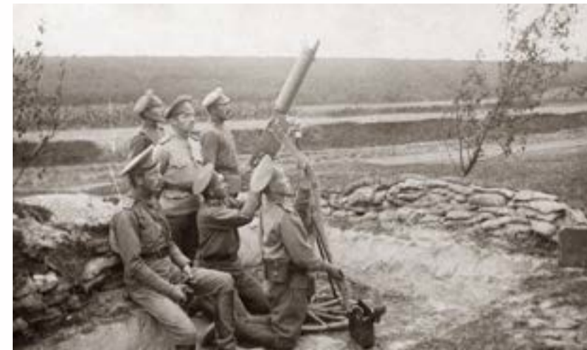
Зенитная пулеметная команда 8-го стрелкового полка

аппаратов в полосе русского Северо-Западного фронта 24 . Три аппарата упали «среди наших войск», четвертый – на территории, занятой противником 25 . В районе д. Едвабне