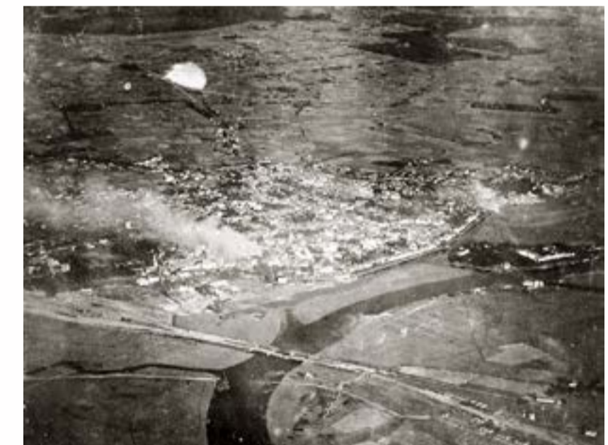
г. Митава. Вид с воздуха