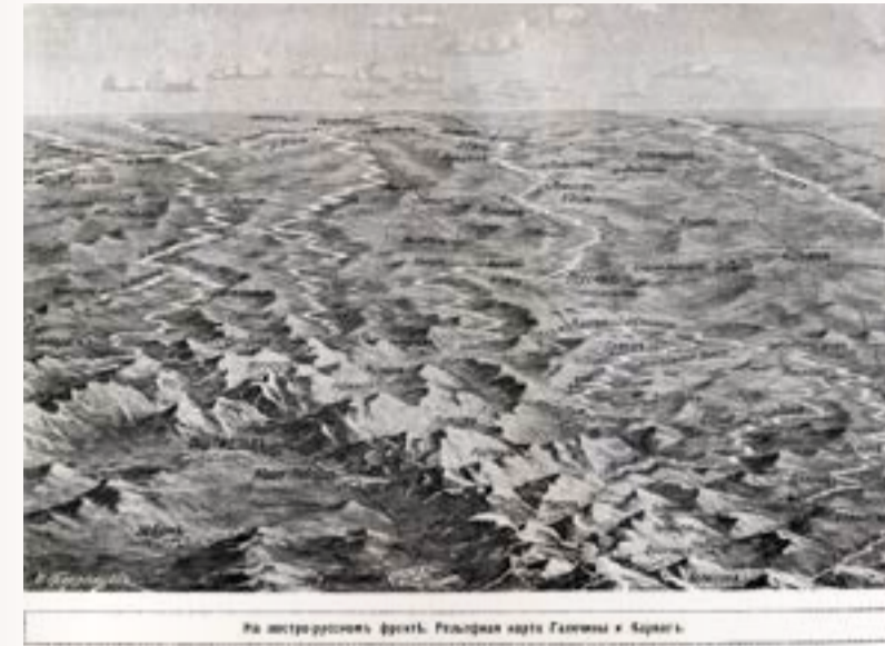
Карта Юго-Западного фронта

станцию противник сбросил 13 авиабомб 7 . По счастливой случайности обошлось без человеческих жертв.