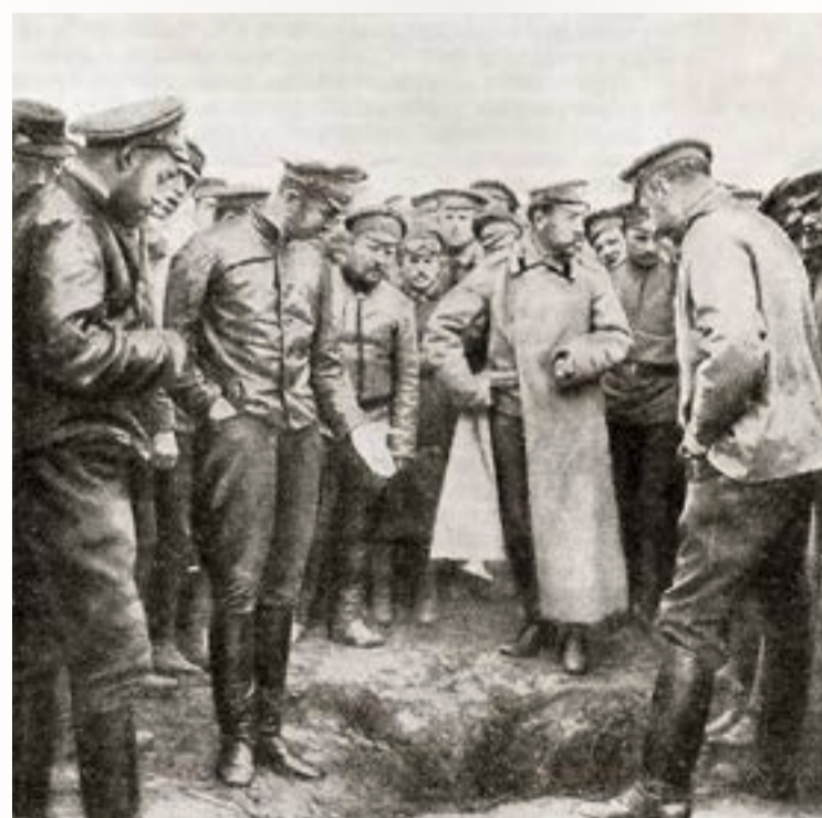
Воронка, вырытая в результате взрыва бомбы, сброшенной с аэроплана

Также противник продолжал совершать налеты на