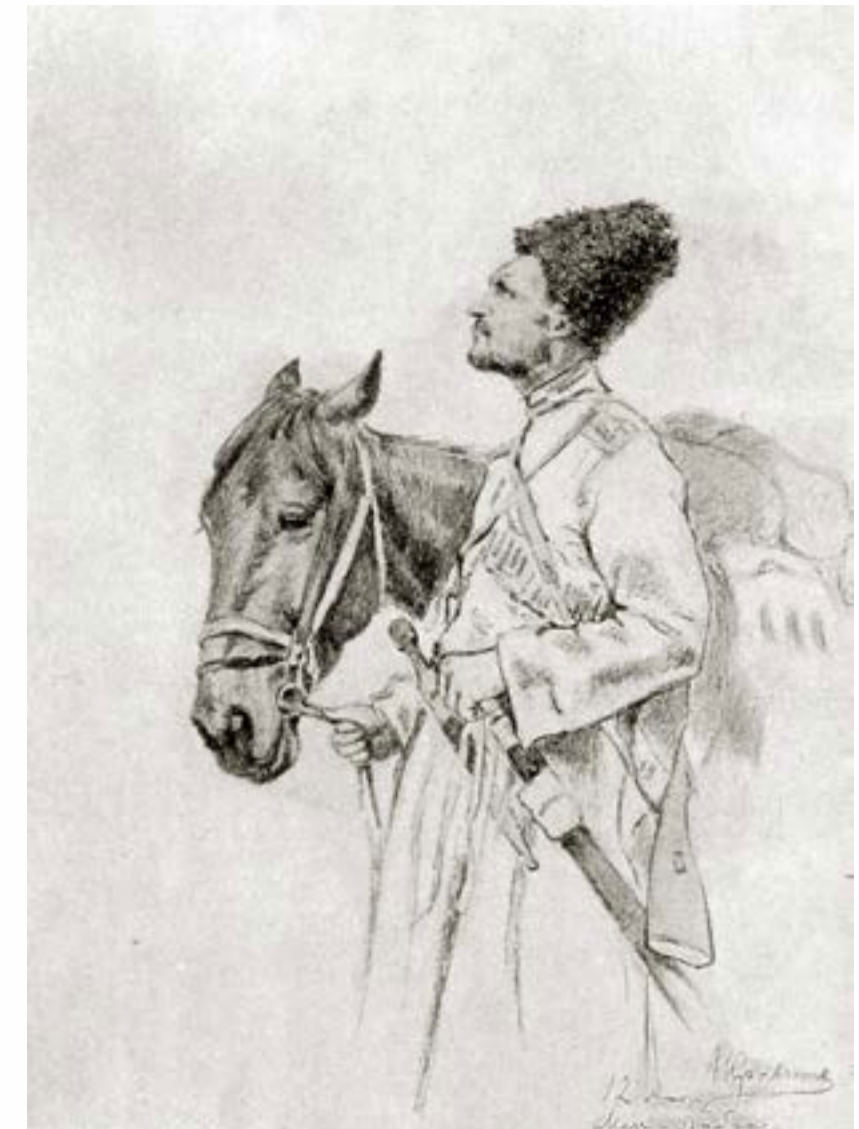
«Аэроплан летит». Рисунок с натуры военного корреспондента, художника Н.И. Краченко

На следующий день рано утром над Люблином был