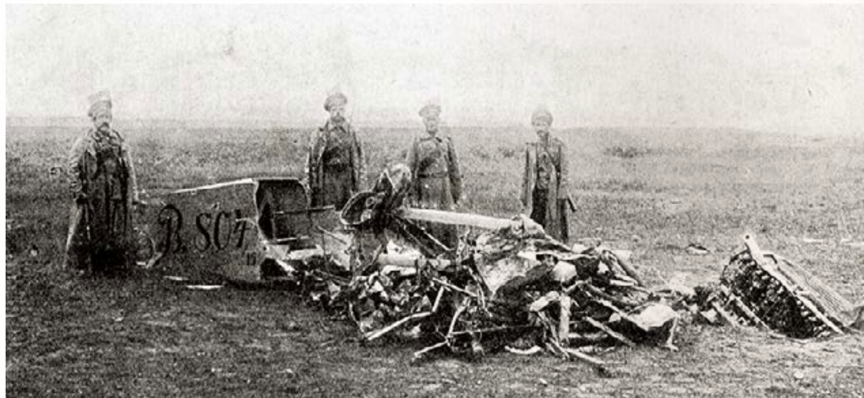
Сбитый немецкий самолет

зенитчикам удалось подбить несколько из них. Это заметно снизило действенность работы вражеской артиллерии. Германские летчики, оценив по достоинству эффективность русской зенитной артиллерии, стремились летать над расположением наших войск исключительно на больших высотах, что значительно снижало результативность их бомбардировок. С этим немецкое командование было вынуждено считаться, так как потеря летательного аппарата обходилась намного дороже, чем расход сотен килограмм боеприпасов.