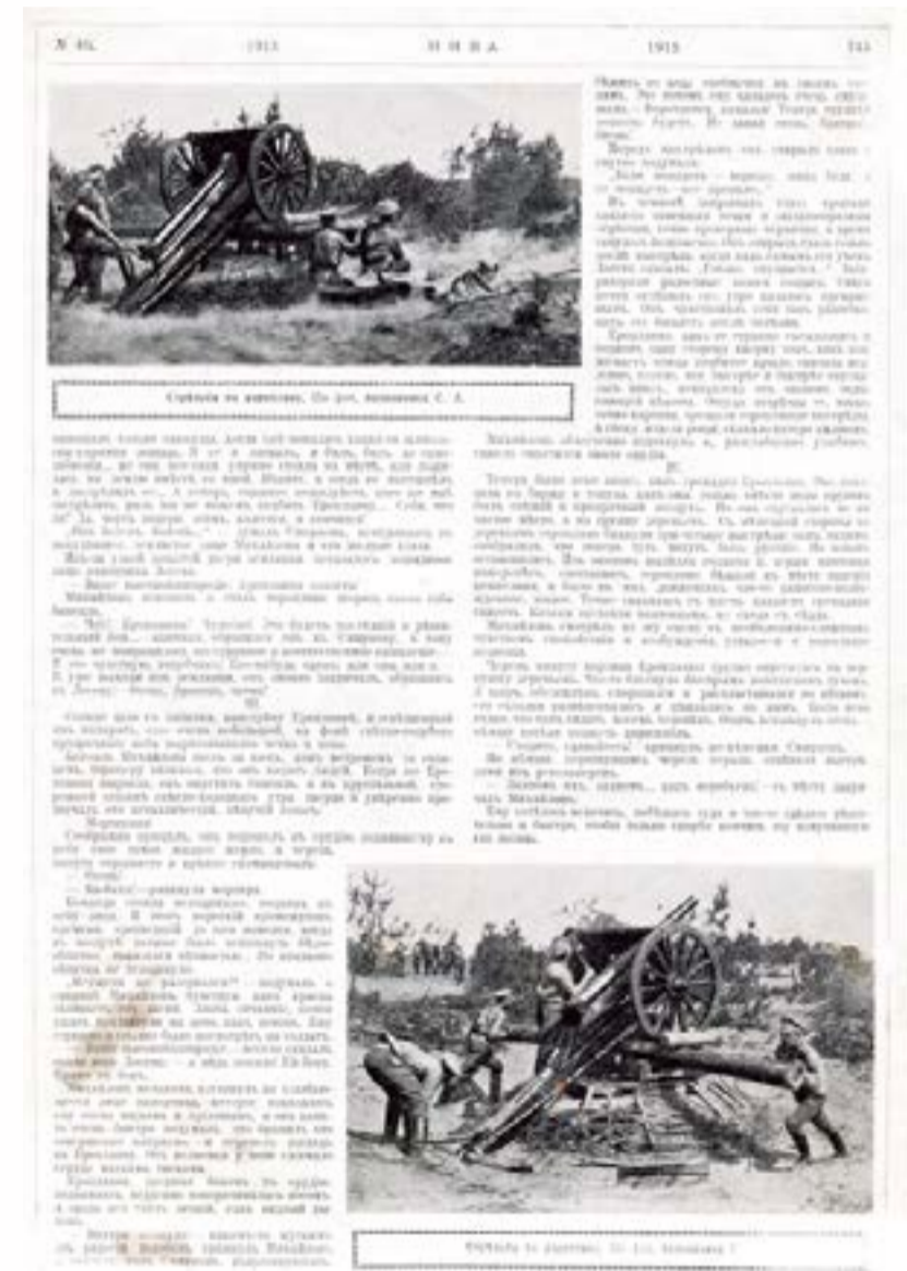
Русские зенитные расчеты

аппаратов в полосе русского Северо-Западного фронта 24 . Три аппарата упали «среди наших войск», четвертый – на территории, занятой противником 25 . В районе д. Едвабне