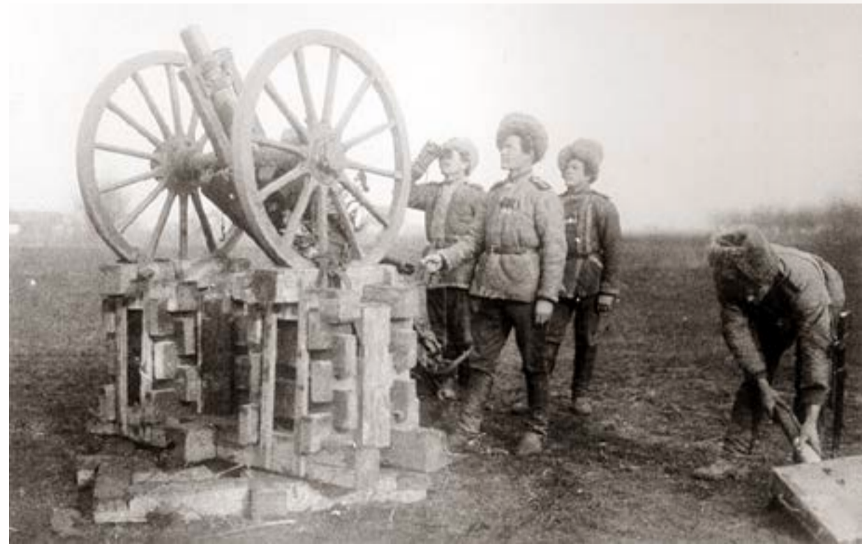
Солдаты 3-го конного корпуса ведут огонь по аэроплану. Г. Новоселица Хотинского уезда Бессарабской губернии, 1915 г.