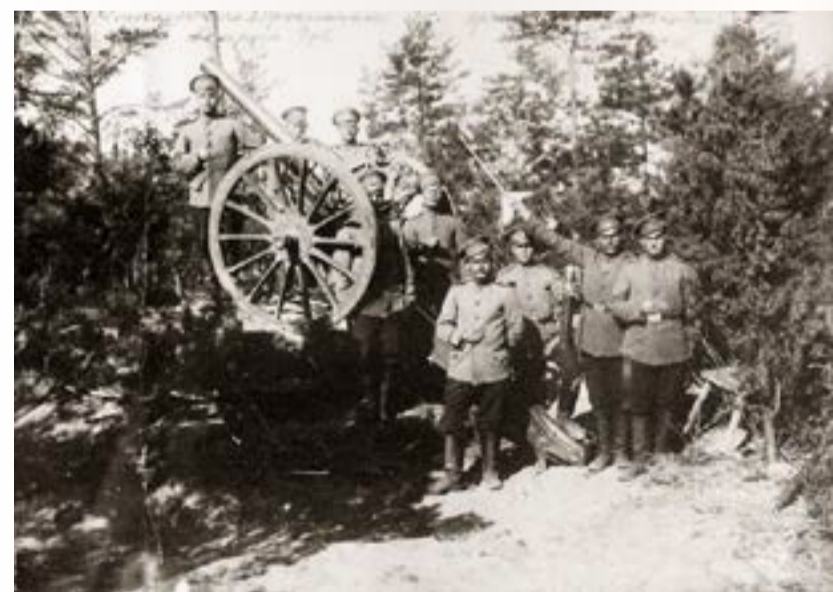
Зенитный расчет. Ломжская губерния Царства Польского