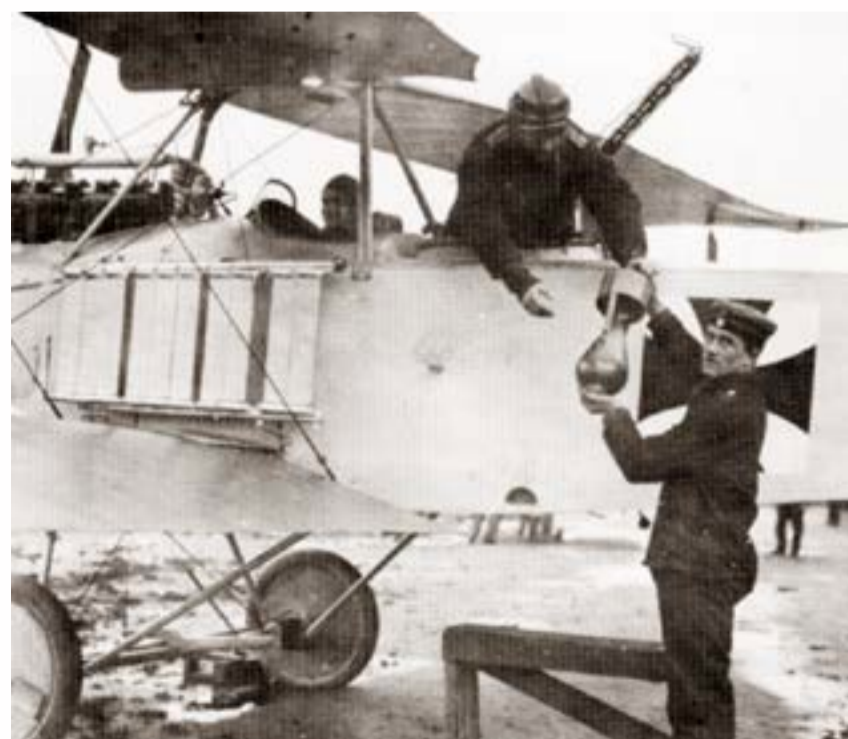
Загрузка авиабомб на самолет

натываясь на зенитный огонь, они были вынуждены набирать большую высоту (недосягаемую для огня русской полевой артиллерии) и с неизрасходованным бомбовым запасом поворачивать обратно.