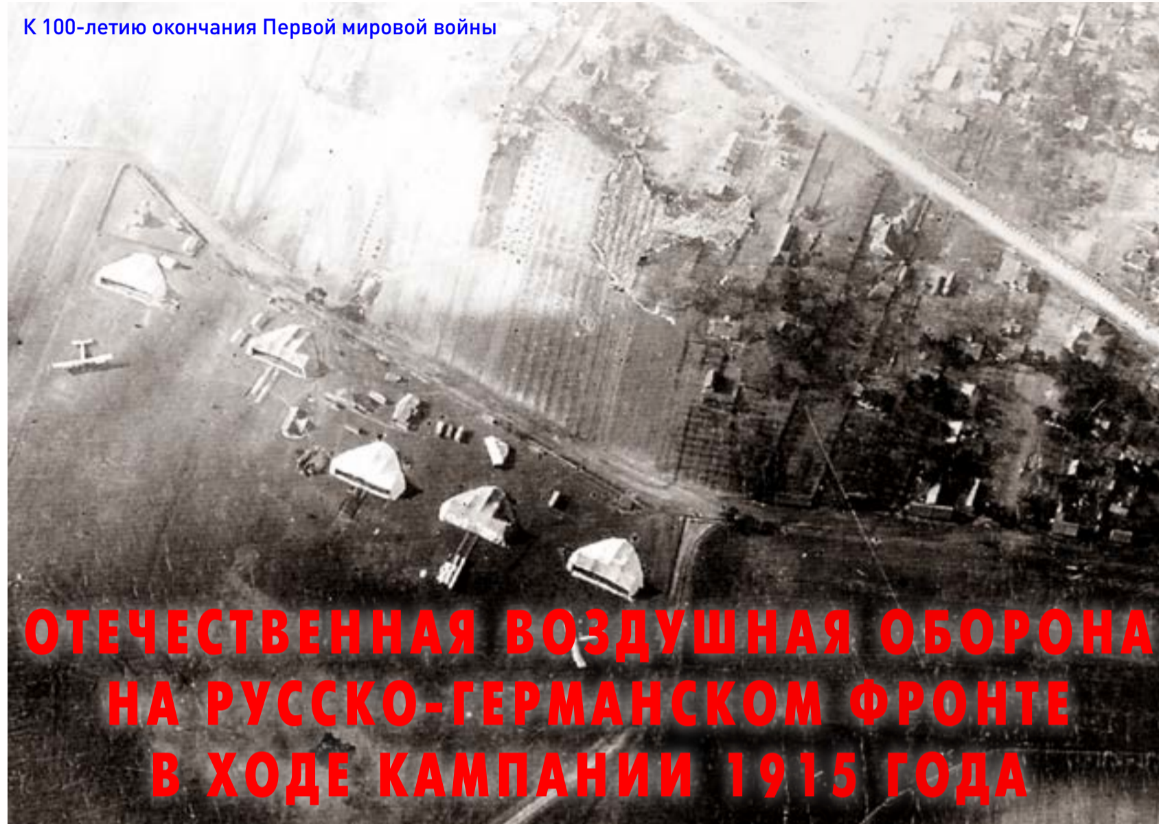
Аэродром УЭВК «Илья Муромец». Ст. Яблонна, Царство Польское

К 100-летию окончания Первой мировой войны