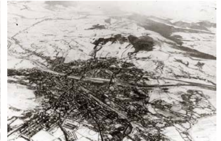
Общий вид г. Перемышля с высоты 1600 м

осаде его крепостных сооружений осенью 1914 г. – весной 1915 года.