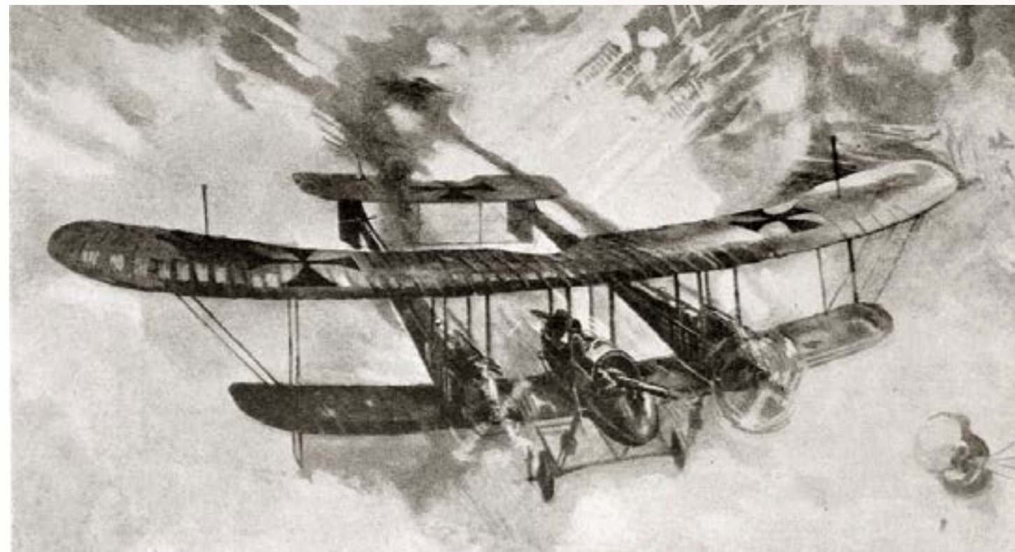
Германский самолет в полете

обнаружен цеппелин, направлявшийся в сторону Брест-Литовска. Встреченный сильным артиллерийским огнем его экипаж изменил первоначальный план и сбросил на город несколько бомб, не причинившие особого вреда 42 . 17 (30) июня немецкий самолет провел бомбометание военных объектов в Жирардове 43 .