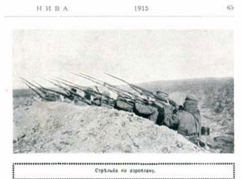
Стрельба по аэрплану.