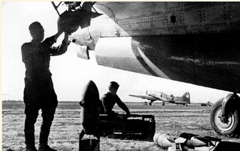
Подвеска бомб на ДБ-3

К сожалению, отсутствие надежного взаимодействия между авиацией и сухопутными войсками привело к тому, что авиационные командиры не имели достоверной, свежей информации о конфигурации фронта и о наиболее опасных прорывах немцев. Удары наносились, в общем, по случайным и второстепенным целям; собственные потери же оказались весьма чувствительными. Так, только за 25 и 26 июня от воздействия истребителей противника было потеряно около сотни советских машин, а к 30 июня в боевом составе ВВС фронта осталось всего 665 исправных и 87 неисправных самолетов при 611 экипажах (без уче-